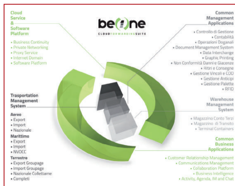
Sintesi delle caratteristiche della soluzione BeOne

Les services logiciels et la gestion des applications sont fournis en mode Cloud, avec un maximum de sécurité et une assistance totale 24 heures sur 24, 7 jours sur 7, 365 jours par an. « BeOne s’intègre profondément aux activités de l’entreprise. Il a plusieurs potentialités applicatives, il est évolutif et indépendant de la taille des entreprises. Il est donc capable de satisfaire aux besoins de chaque client », souligne Avesani. Les services proposés par BeOne peuvent être intégrés les uns aux autres pour mieux suivre la croissance de l’entreprise et sont répartis en cinq macro modules, chacun répondant à une fonctionnalité précise : à partir du service Cloud et du logiciel de gestion des transports (Transportation Management System), qui comprend le système de gestion des secteurs aérien (Export et Import), Maritime (Export, Import, National et