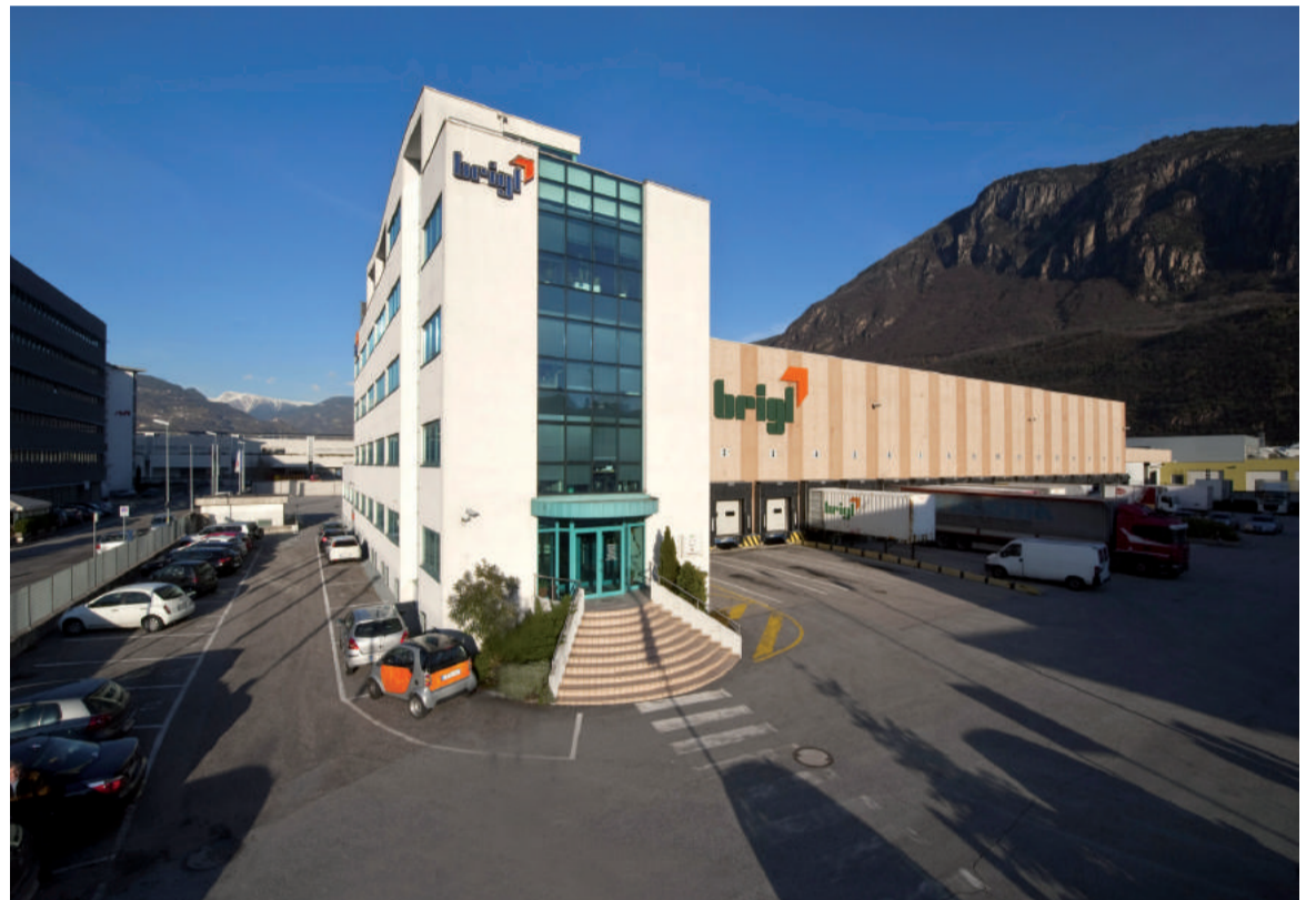
La sede della Brigl a Bolzano. L'impresa, fondata nel 1925, propone un'offerta completa di trasporto (collettame, carichi parziali o completi) per tutta Italia e tutta Europa. Opera inoltre nel comparto delle spedizioni internazionali (via mare e aereo) nonché nell'offerta di servizi doganali e logistici integrati

quantité de données est devenue l'une des principales conditions de la croissance », explique Goggi mettant en lumière les problèmes dans le monde des transports où « nous travaillons beaucoup, mais les résultats ne sont parfois pas proportionnels à l'effort ». Aujourd'hui, Brigl fait partie de ces entreprises que les experts définissent comme des « data equipped », pour souligner l'importance de la gestion correcte de l'information. Le vocabulaire anglo-saxon est utilisé pour s'orienter dans le vaste océan que représente l'économie numérique. Et donc le stock est transformé en data-warehouse et les activités quotidiennes reprennent la data analytics, mais pour arriver à convertir Brigl à penser à la Business Intelligence, cela a été nécessaire de mettre en