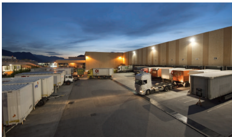
Brigl vanta un fatturato intorno ai 18 milioni di euro e impiega 61 collaboratori. La sua vocazione internazionale l'ha portata ad aderire a consorzi come CargoLine, CDS e Palletways